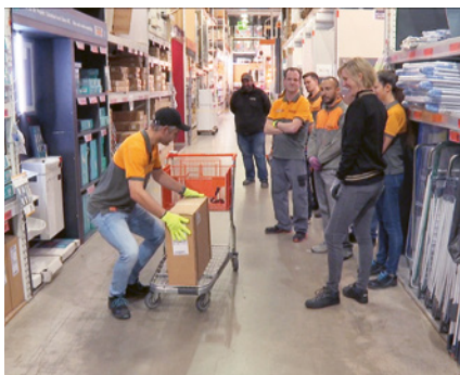
Esempio ergonomia: modulo «Sollevare e trasportare»