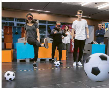
Esempio tirocinio: modulo «Percorso interattivo»

La nostra ampia offerta comprende più di 40 moduli su 16 argomenti diversi: regole vitali, sport sulla neve, apprendisti, amianto, gestione delle assenze, bici, cadute in piano e molto altro ancora.