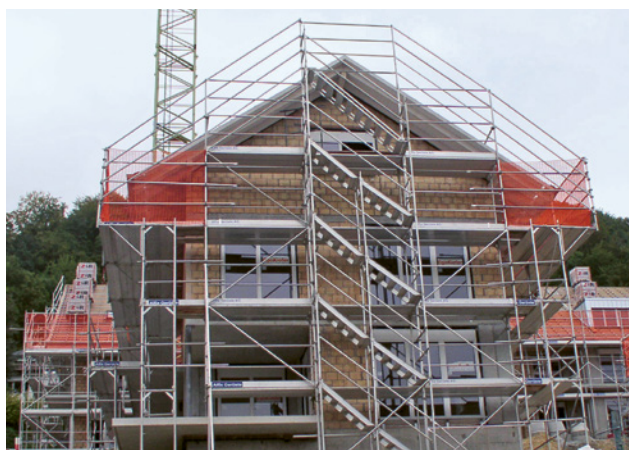
3 Échafaudage de façade avec des escaliers correctement mis en place.