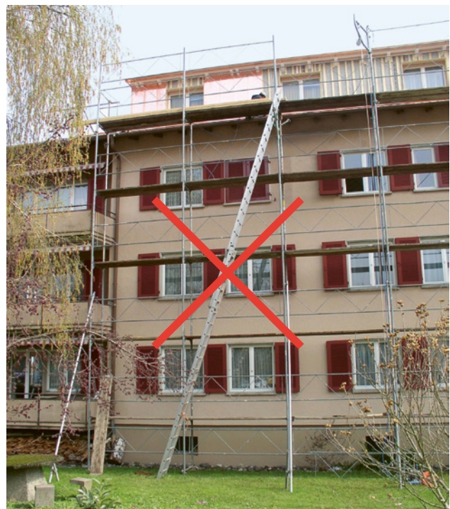
1 Il est interdit d'utiliser des échelles mobiles pour accéder aux ponts d'échafaudage.

En principe, seuls les escaliers sont admis pour accéder aux échafaudages en toute sécurité. Il est donc interdit d'utiliser des échelles mobiles pour accéder aux ponts d'échafaudage.