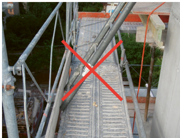
4 Cette échelle repose sur une surface instable. Si la plinthe cède, la chute est inévitable.