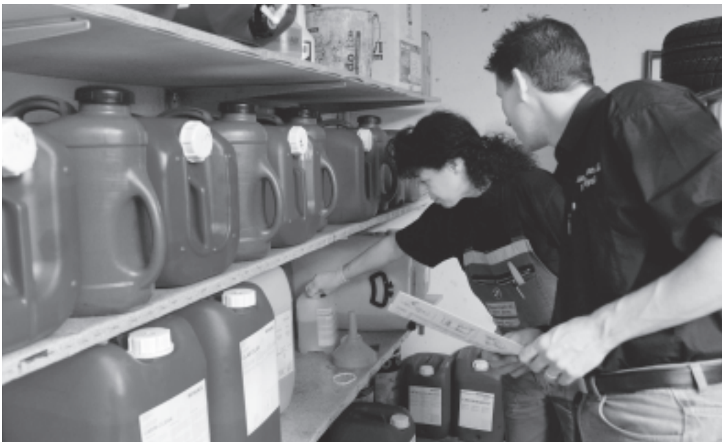
Figura 2 Magazzino per sostanze pericolose. Bisogna tener conto dei pericoli derivanti dall'uso di sostanze pericolose.