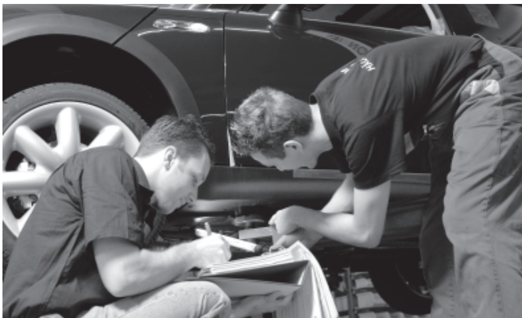
Figura 3 Individuazione dei pericoli sul posto di lavoro.

Non dimenticate i pericoli associati alle attività di pulizia, eliminazione guasti e manutenzione.