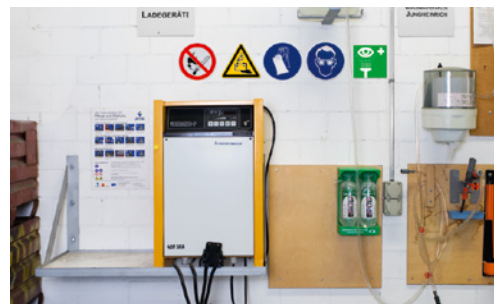
5 Stazione di caricabatterie a norma con cartello di divieto di fumo, occhiali di protezione e doccia oculare