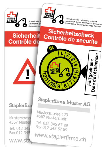
4 Adesivo con funzione di certificato di manutenzione