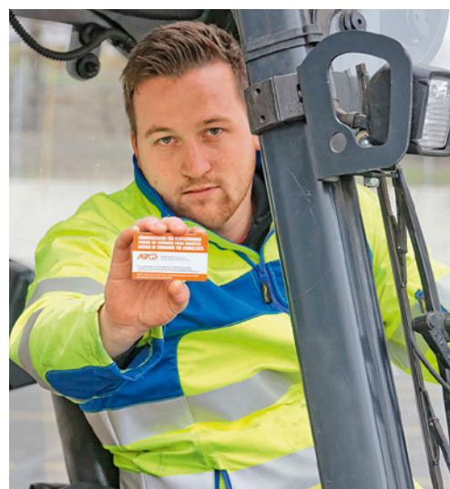
7 Per manovrare un carrello trilaterale per corridoi stretti serve un attestato di formazione per la categoria R2.

Le categorie di carrelli elevatori, i requisiti per la formazione e l'addestramento degli operatori sono indicati nella direttiva CFSL 6518.