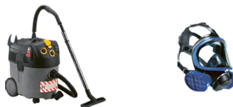
1: esempi di attrezzature di lavoro impiegate in una bonifica da amianto

Importante: bisogna individuare i potenziali pericoli dovuti alla pulizia delle attrezzature di lavoro contaminate da amianto prima di iniziare i lavori.