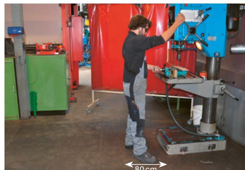
1 Pour travailler en toute sécurité, il faut respecter une distance d'au moins 80 cm et s'assurer qu'il n'existe aucun risque de trébuchement.