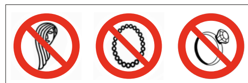
7 Les cheveux longs doivent être noués ou couverts. Il est interdit de porter des bijoux lorsque l'on travaille sur une perceuse.