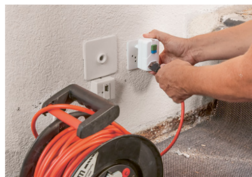
6 Wenn keine FI-geschützte Steckdose vorhanden ist: Mobile FI-Schalter anschliessen.