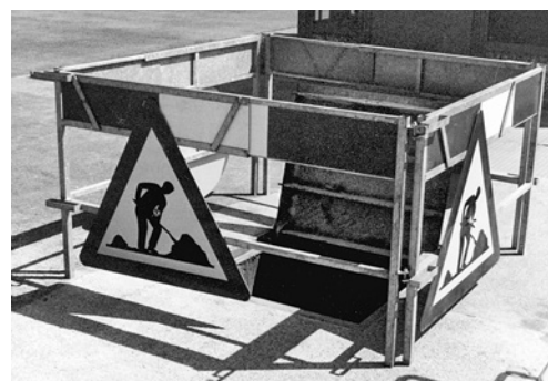
5 Abspernung einer Grube. Gefährdungen, die durch das Ausführen der Arbeiten beim Kunden entstehen, müssen in Zusammenarbeit mit dem Kunden entschärft werden.