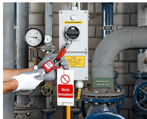
4 Sicherheitsschalter in der 0-Stellung mit einem persönlichen Vorhängeschloss gegen Wiedereinschalten gesichert.