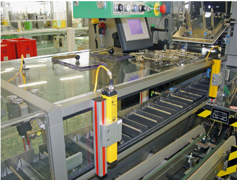
Se una persona si introduce nella zona dietro le barriere immateriali, la macchina si arresta immediatamente.