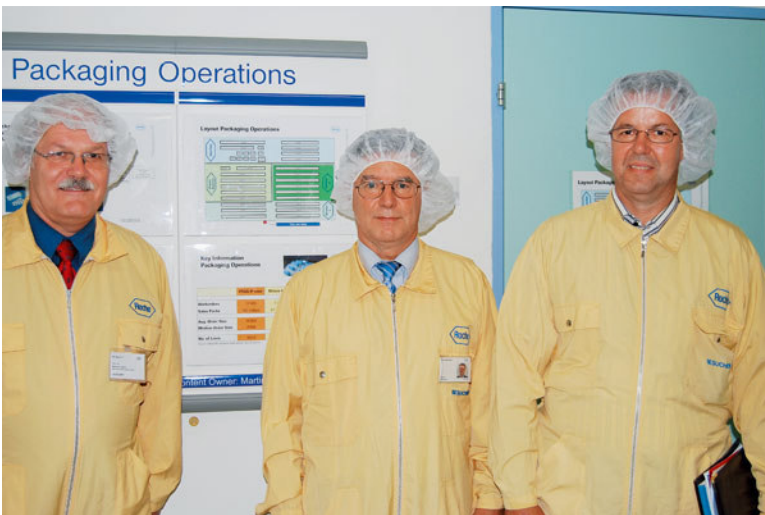
Nel reparto imballaggio vigono norme molto severe in quanto ad igiene e sicurezza: anche i visitatori devono indossare indumenti speciali.