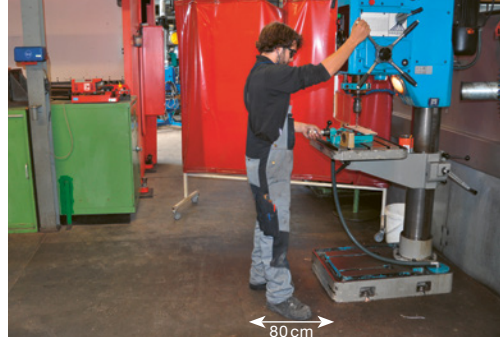
1 Für ein sicheres Arbeiten ist ein Freiraum von mindestens 80 cm erforderlich. Weitere Kriterien: frei von Stolperfallen