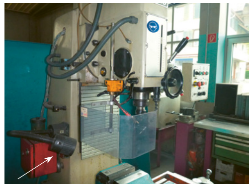
2 Eine lokale Hilfslampe (links) sorgt für gute Beleuchtung im unmittelbaren Bohrbereich.