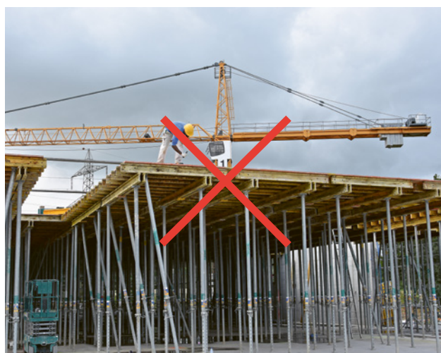
2 Vietato: messa in opera senza un dispositivo anticaduta con un'altezza di caduta elevata