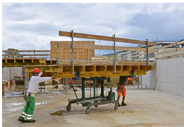
5 Modulo con protezione collettiva già montata (protezione laterale a tre elementi) durante il trasporto

A partire da un'altezza di caduta di 2 m l'accesso ai bordi con rischio di caduta deve essere messo in sicurezza con una protezione laterale perimetrale a tre elementi o con uno sbarramento posto ad almeno 2 m dai bordi.