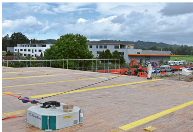
3 Casseratura con imbracatura di sicurezza testata e certificata