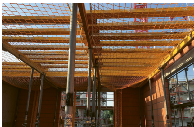
4 Casseratura convenzionale con dispositivo di sicurezza testato e certificato (reti di sicurezza)

Quando si impiegano dei moduli di cassetta occorre adottare, se possibile, misure collettive di protezione contro le cadute, come una protezione laterale a tre elementi montata in precedenza.