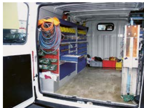
4 Le matériel est correctement rangé dans le véhicule.