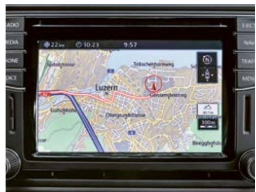
2 Le GPS permet de se rendre directement chez un client sans risquer de se tromper d'adresse.