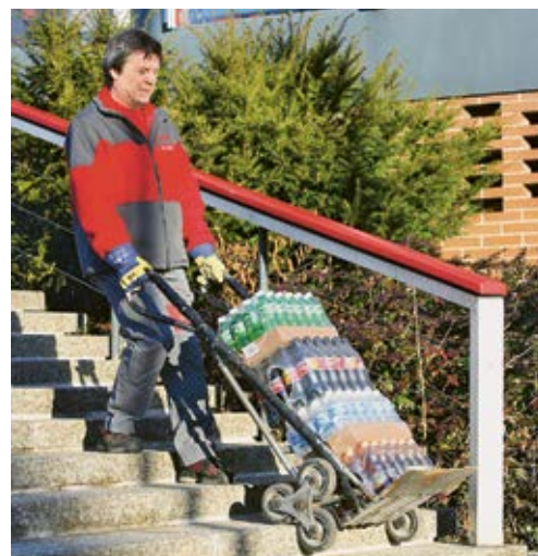
3 Utilisez des équipements appropriés (diable d'escalier, etc.)!