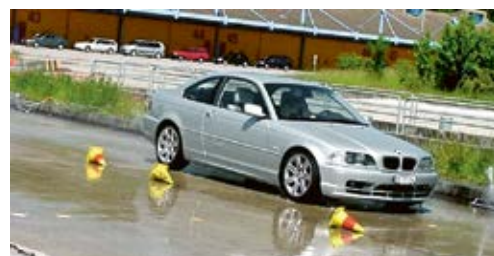
5 Des cours de sécurité routière permettent d'acquérir de l'aisance au volant.