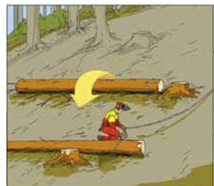
3 Attenzione ai tronchi che rotolano via oppure a valle