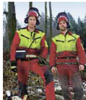
2 Garantire sempre la comunicazione nel team, ad es. con la ricetrasmittente.