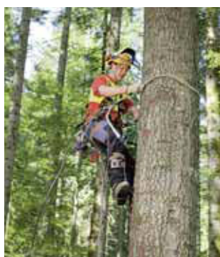
Regola 6 Protegersi contro le cadute.