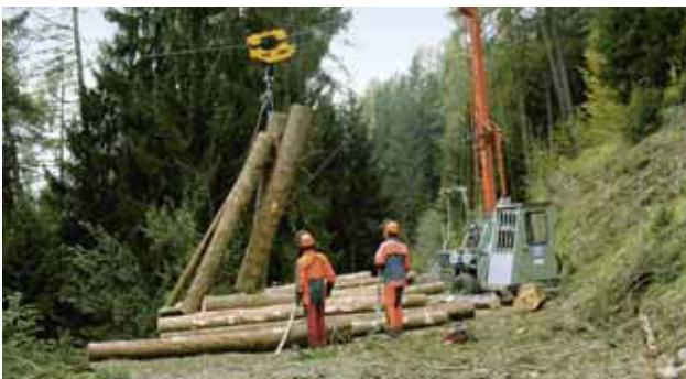
1 Trasporto di legname con teleferica