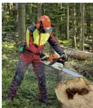
Regola 10 Utilizzare i dispositivi di protezione.

Dieci semplici regole per la tua incolumità