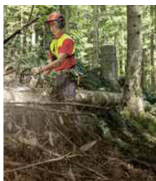
Regola 5 Non sostare sotto tronchi e carichi.