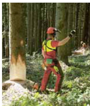
Regola 3 Sorvegliare la zona di pericolo e la zona di caduta.