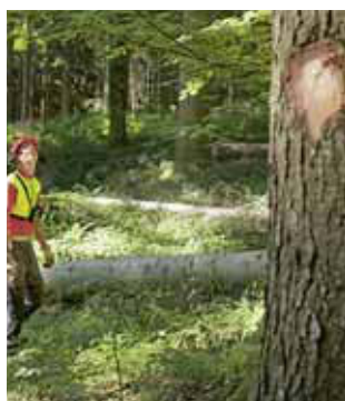
Regola 2 Esaminare l'albero.