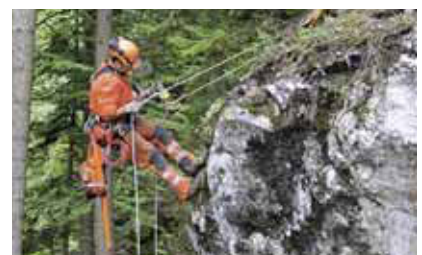
3 Per questa operazione servono due funi