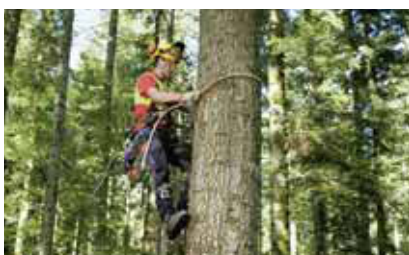
1 Protezione mediante la cintura di arrampicata