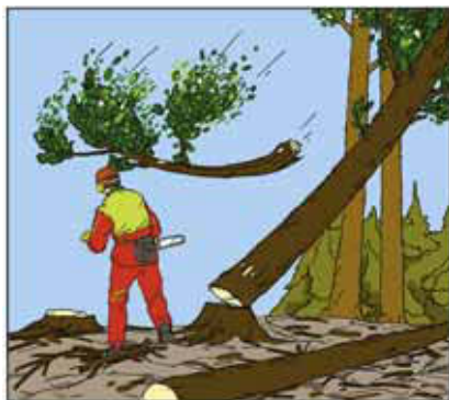
1 Ramo scaraventato all'indietro