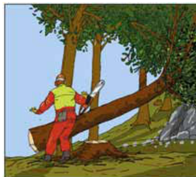
3 Base del tronco rimbalzata all'indietro