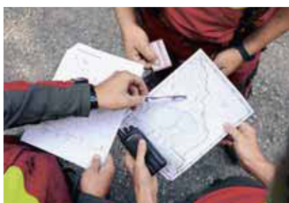
1 Discutere dell'organizzazione per i casi di emergenza