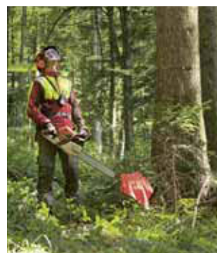
Regola 4 Raggiungere il luogo di ritirata.