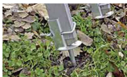
2 Piedi delle scale a pioli sicuri