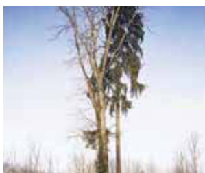
1 Altezza dell'albero