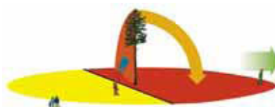
2 L'inclinazione naturale dell'albero diverge lateralmente dalla direzione di caduta prevista, zona di caduta fino a 180°