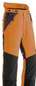
3 Pantaloni antitaglio