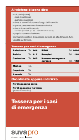
3 Tessera individuale per i casi di emergenza