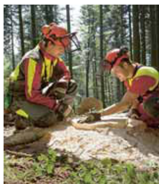
Regola 9 Assistere gli apprendisti.