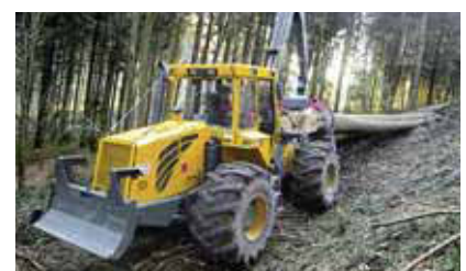
3 Trattore forestale: manutenzione secondo le indicazioni del fabbricante