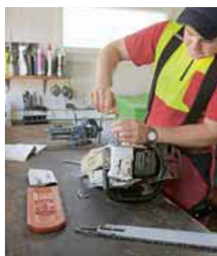
Regola 7 Usare attrezzature di lavoro in perfetto stato.