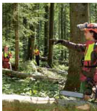
Regola 1 Non lavorare da soli.