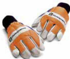
2 Guanti di protezione