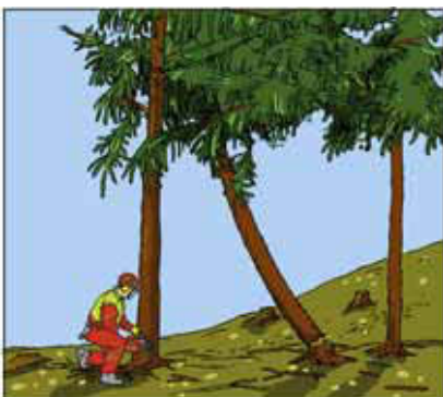
1 Mai abbattere l'albero d'appoggio