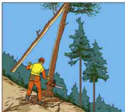
2 Tronco spaccato lungo l'asse verticale