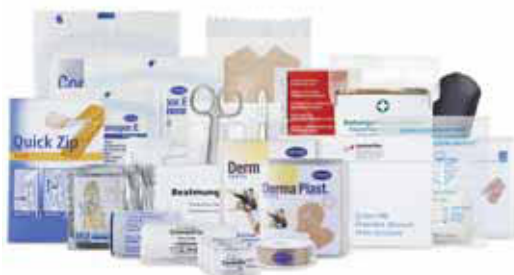
2 Materiale di pronto soccorso