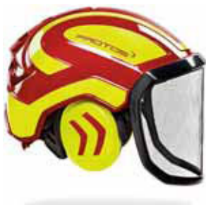
1 Casco per lavori forestali