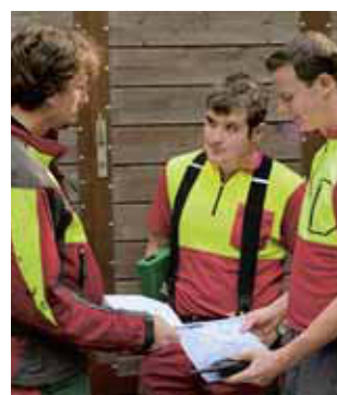
Regola 8 Garantire i primi soccorsi.