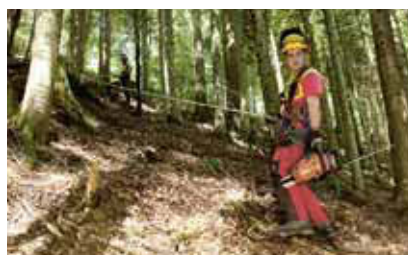
2 Protezione sui pendii ripidi