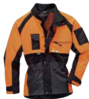
4 Giacca ad alta visibilità