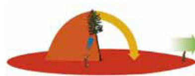
3 L'inclinazione naturale dell'albero è opposta alla direzione di caduta prevista, zona di caduta 360°