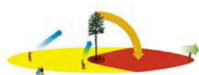
1 Caso normale, zona di caduta 90°