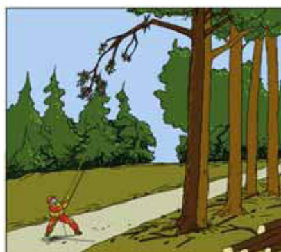
2 Eliminare subito il pericolo