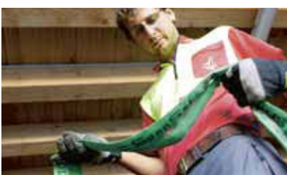
1 Controllo delle cinghie d'ancoraggio