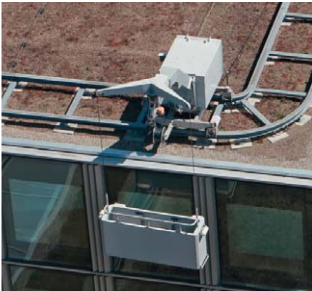
Impalcature mobili per facciate