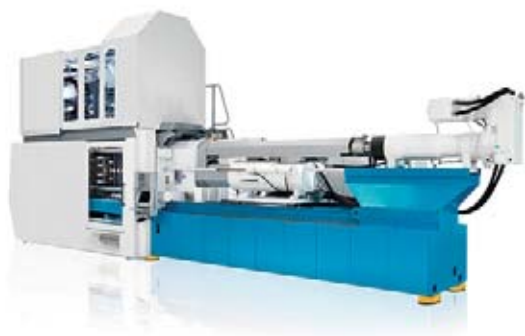
Pressa a iniezione

Esempi tratti dai nostri campi di attività