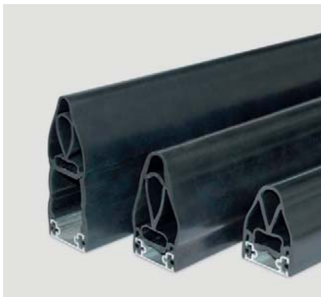
Bordi sensibili alla pressione: sensori

Esempi tratti dai nostri campi di attività