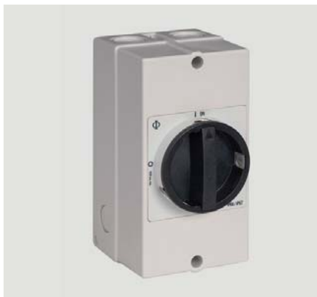
Interruttore di manovra-sezionatore