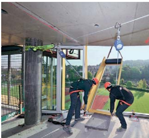
Dispositivo di ancoraggio

Esempi tratti dai nostri campi di attività