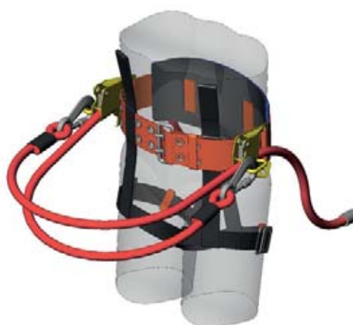
Cintura di posizionamento sul lavoro e di trattenuta