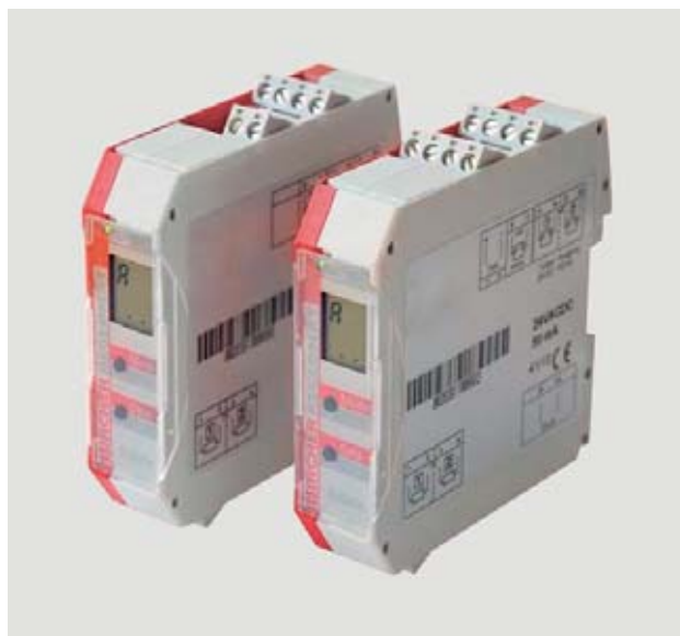
Bordi sensibili alla pressione: moduli di sicurezza