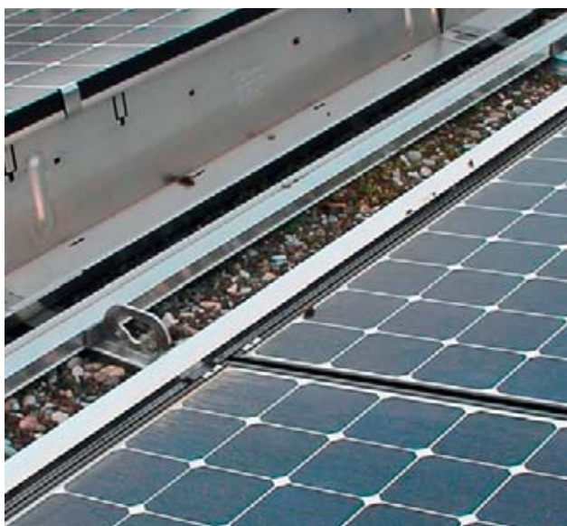
Punto di ancoraggio sull'impianto fotovoltaico