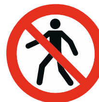
6 Panneau d'interdiction «Interdit aux piétons»