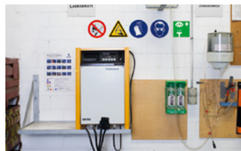
5 Station de recharge des batteries réglementaire avec interdiction de fumer. Des lunettes de protection et une douche oculaire sont à disposition.