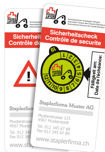
4 Vignette de maintenance