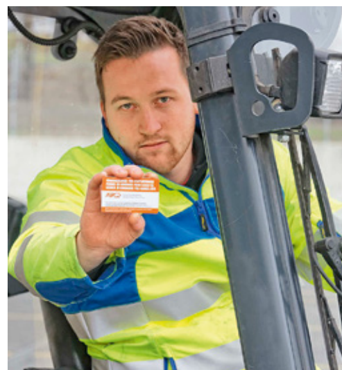
7 Pour conduire un chariot grande hauteur, il faut une attestation de formation R2. Les différentes catégories de chariots élévateurs et les exigences concernant la formation et l'instruction des opérateurs sont définies dans la directive CFST 6518.