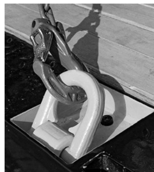
2 Punto di fissaggio previsto per la messa in sicurezza del carico