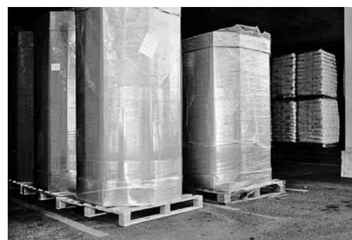
6 Il materiale imballato e immagazzinato correttamente può essere caricato senza problemi.

È possibile che nella vostra azienda esistano altre fonti di pericolo su questo argomento. In tal caso, occorre adottare i necessari provvedimenti e annotarli sull'ultima pagina.