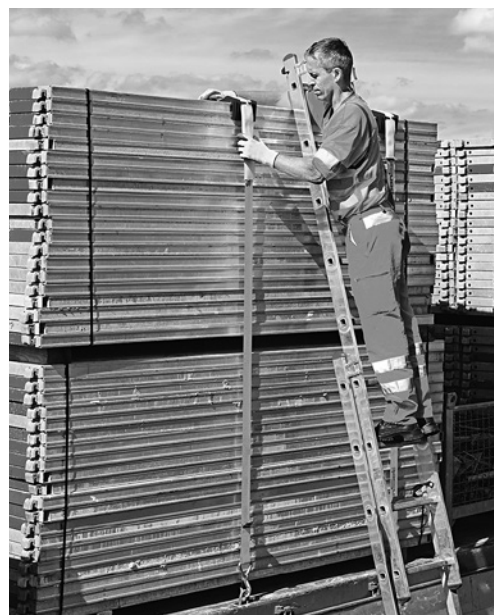
3 Messa in sicurezza del carico da una scala a pioli