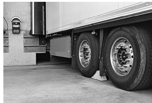
4 Veicolo stabilizzato alla rampa e al punto di carico con cunei bloccaruote