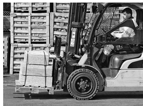
5 Carico messo in sicurezza con fascette