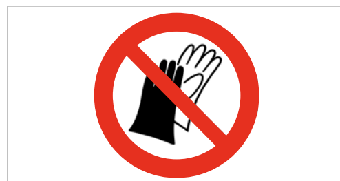
6 È vietato usare i guanti con la macchina in funzione.