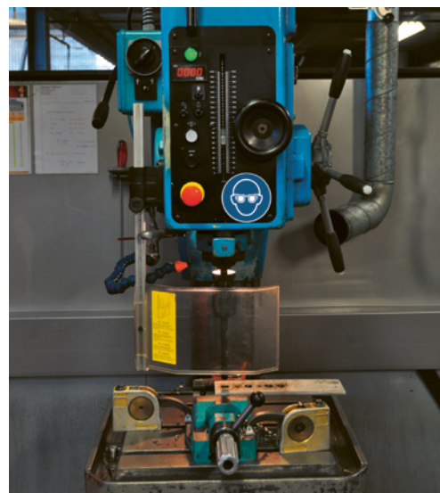
4 Dispositivo di protezione interbloccato: copertura girevole del trapano