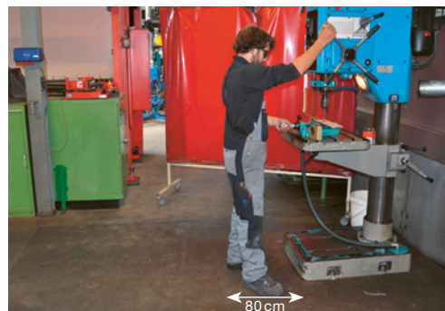
1 Spazio libero minimo di 80 cm per lavorare in sicurezza. Ulteriori criteri: locale privo di ostacoli.