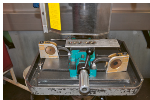
3 Morsa con meccanismo di bloccaggio rapido