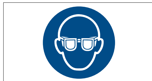
5 Il segnale di protezione obbligatoria degli occhi deve essere affisso in un punto ben visibile in prossimità del trapano.