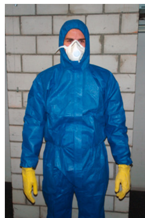
3 Korrekte Ausrüstung mit Einwegschutanzug