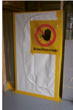
4 Dieser Sanierungsbereich ist räumlich sauber abgetrennt und gekennzeichnet.

BauAV (Bauarbeitenverordnung) Art. 3.2, 4, 81-86 EKAS-Richtlinie 6503 «Asbest»