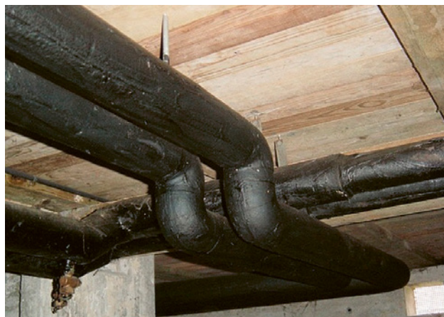
1 Diese Isolation mit bituminösem Anstrich lässt sich mit dem Cutter leicht aufschneiden und entfernen.