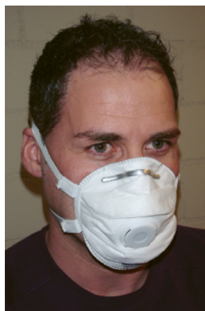
2 Einwegstaubmaske des Typs FFP3