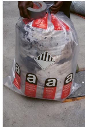
6 Kunststoffsack mit der Kennzeichnung «Asbest»