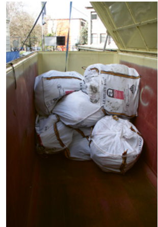
7 Abschliessbare Mulde