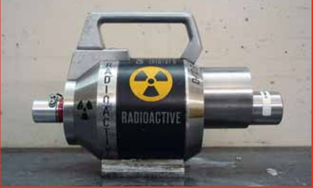
Unité d'irradiation avec source radioactive intégrée