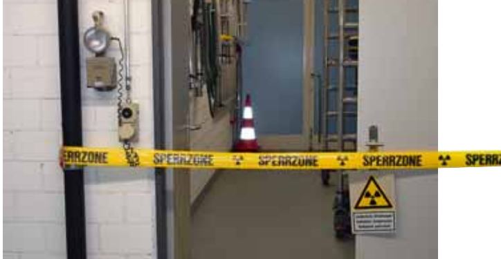
Délimitation de la zone contrôlée