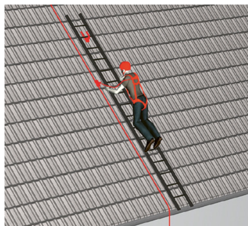
3 Sui tetti con un'inclinazione compresa tra 40° e 60°, oltre ai dispositivi anticaduta è richiesta una scala da copritetto.