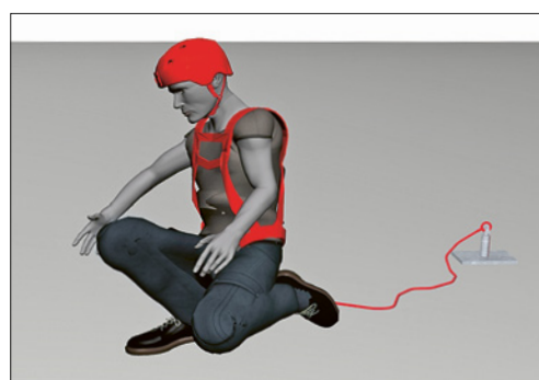
2 Sui tetti con un'inclinazione fino a 60° è necessario almeno un dispositivo anticaduta.