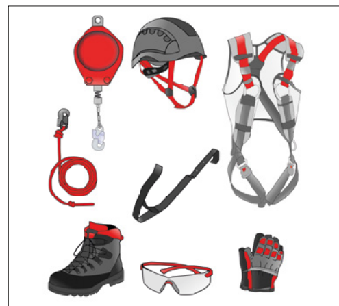
6 Sicuri che tutti i lavoratori utilizzano i DPI?

È possibile che nella vostra azienda esistano altre fonti di pericolo su questo argomento. In tal caso, occorre adottare i necessari provvedimenti e annotarli sull'ultima pagina.