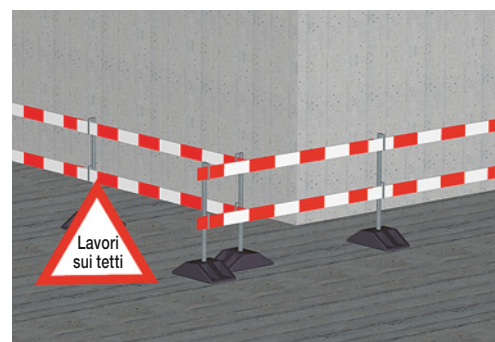
5 Delimitazione della zona di pericolo