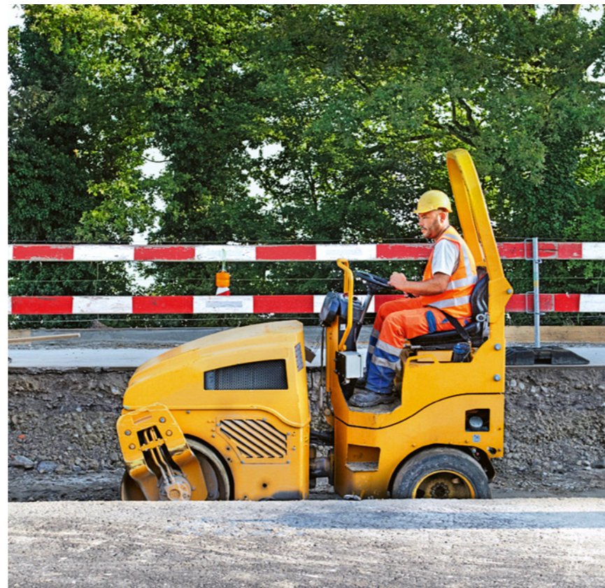
Regola 5: manovriamo le macchine secondo le disposizioni.