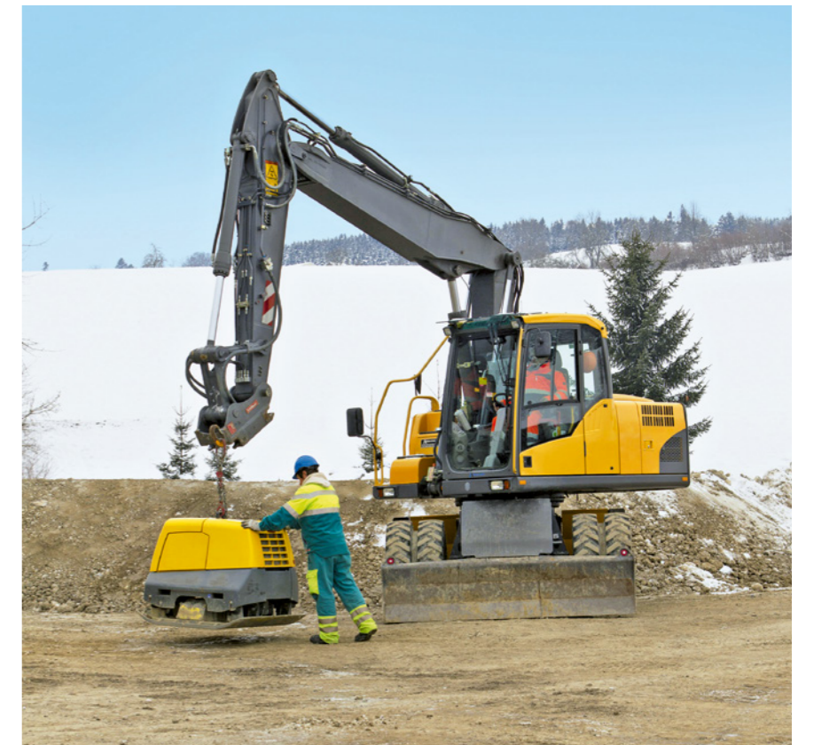
Regola 6: trasportiamo e movimentiamo i carichi in sicurezza.