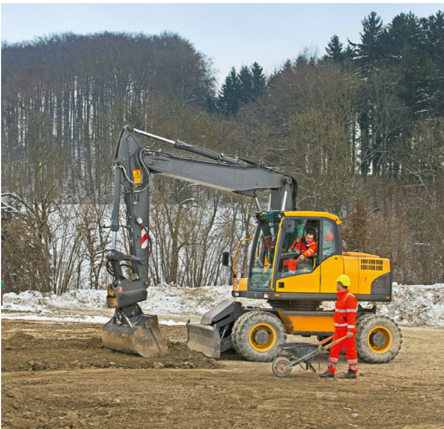
Regola 4: stabiliamo un contatto visivo con il macchinista.