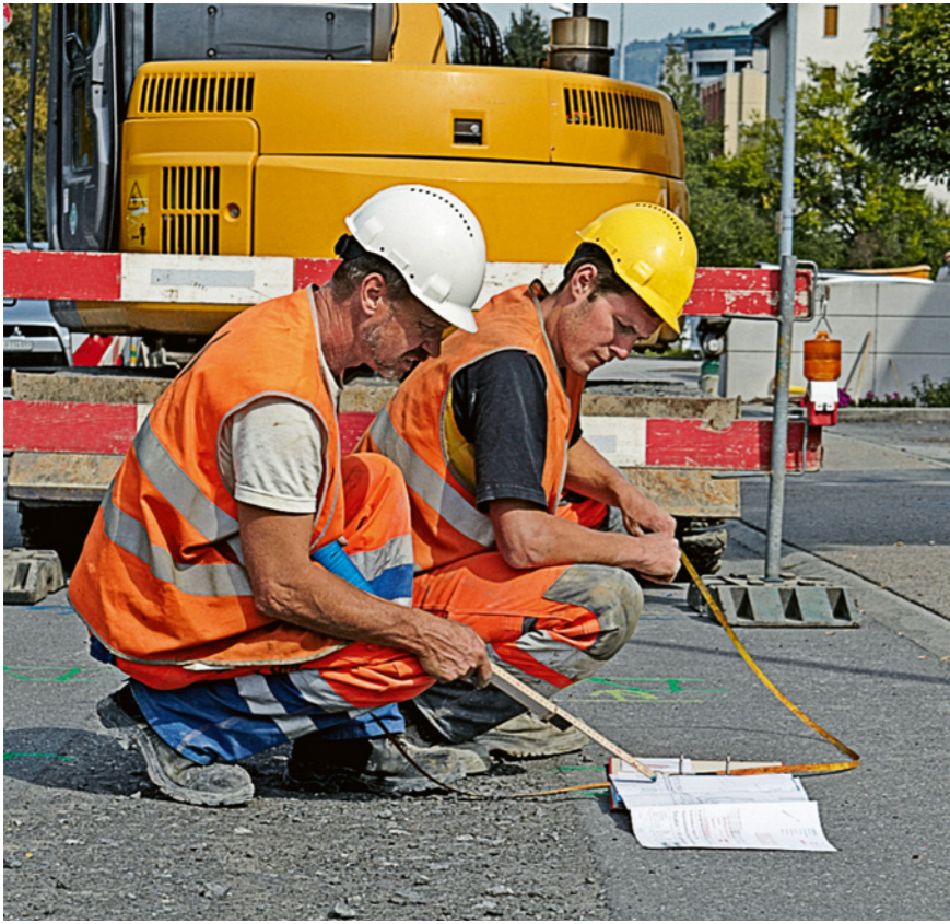
Regola 1: pianifichiamo con cura ogni intervento.