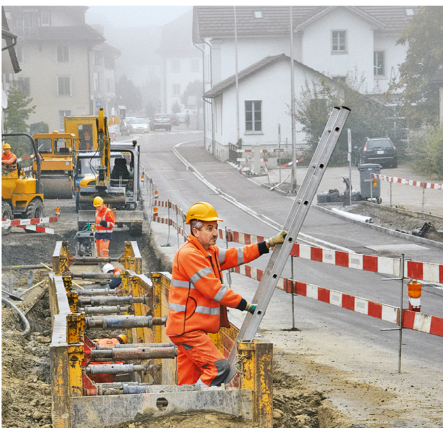
Regola 7: realizziamo accessi sicuri per ogni postazione di lavoro.