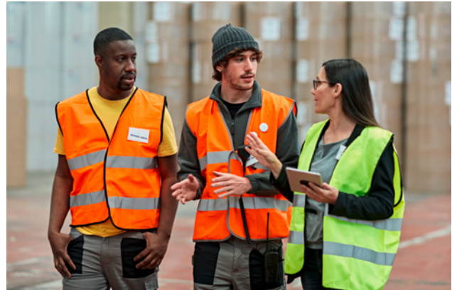
1 Die Mitwirkung der Mitarbeitenden bei der Gefährdungsermittlung und Massnahmenplanung bringt dem Betrieb Vorteile.

In dieser Publikation wird das Wort «Gefährdung» verwendet. Es hat die gleiche Bedeutung wie das Wort «Gefahr» und steht für eine potenzielle Schadensquelle.