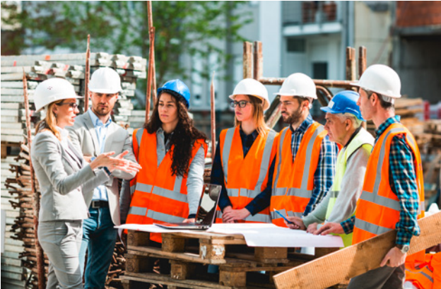
5 Betriebsinterne Sicherheitsrundgänge mit Einbezug der Mitarbeitenden

Bei den Sicherheitsrundgängen steht das Verhalten der Mitarbeitenden im Mittelpunkt: Durch Beobachtungen und Gespräche erhalten Sie wertvolle Hinweise auf organisatorische und sicherheitstechnische Schwachstellen. Nutzen Sie die Gefährdungstabelle im Anhang 1 für eine systematische und vollständige Beurteilung der Arbeitsplätze.