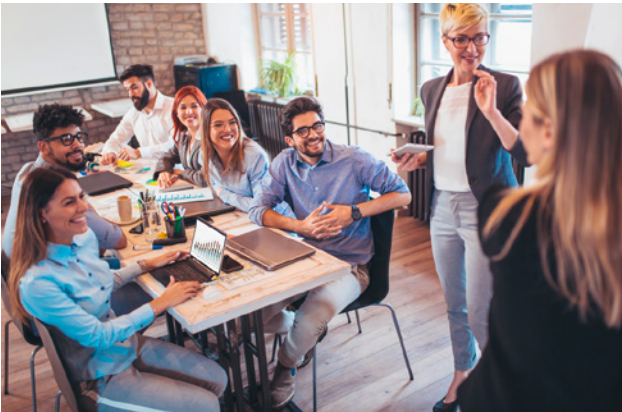
6 Das Fachwissen über Arbeitssicherheit und Gesundheitsschutz kann man sich in diversen Kursen aneignen.

Als Arbeitgeber oder Arbeitgeberin können Sie sich das erforderliche Wissen über Arbeitssicherheit und Gesundheitsschutz selbst aneignen oder einen Mitarbeiter bzw. eine Mitarbeiterin zum «Sicherheitsbeauftragten» ausbilden lassen. Das Wissen dazu wird in diversen Branchen- und Suva-Kursen vermittelt: www.suva.ch/kurse .