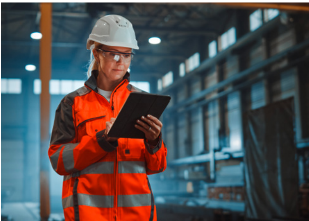
3 Gefährdungsermittlung am Arbeitsplatz.