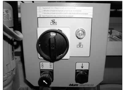
Foto 1: l'interruttore di sicurezza toglie l'alimentazione alle installazioni pericolose.