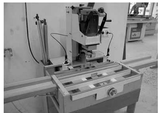
Foto 4: un appoggio sicuro impedisce ai pezzi lunghi di ribaltarsi.