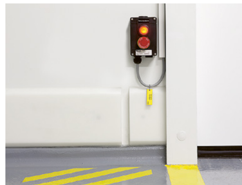
5 Alarmschalter mit Beleuchtung

11 Ist innerhalb des Kühlraums ein Alarmschalter vorhanden? (Bild 5)