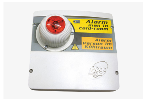
6 Einfache Alarmanlage

13 Ist sichergestellt, dass sich durch austretende Kältemittel (z. B. CO 2 ) keine gefährliche Konzentration im Kühlraum bilden kann? (Bild 7)