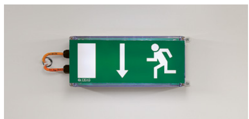
4 Notbeleuchtung (elektrisch)