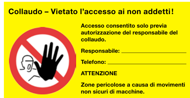
Fig. 1: esempio di segnale di avvertimento

Nella pianificazione del collaudo bisogna innanzitutto definire le attività e l'ordine in cui queste devono essere svolte, nonché la procedura di lavoro e le persone da impiegare. Occorre inoltre determinare quali dispositivi di protezione dell'esercizio normale saranno attivi ed efficaci durante il collaudo e in quale fase.