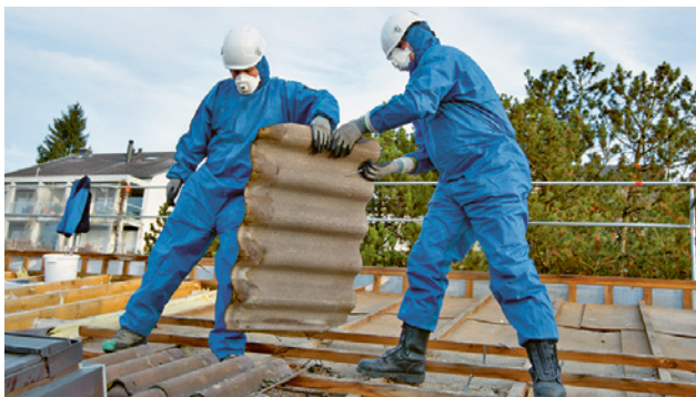
1 Lors des travaux de démontage, les plaques de fibrociment en amiante doivent être laissées en l'état.