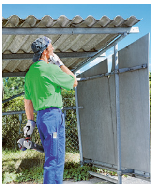
Règle 7 Se protéger contre les fibres d'amiante