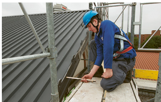
1 Distance entre l'échafaudage et la façade: max. 30 cm.