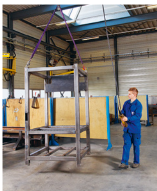
Règle 4 Transporter correctement les charges