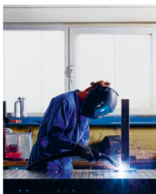
Règle 6 Se protéger contre les fumées de soudage