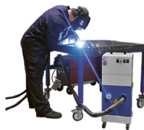
3 Chalumeau avec système d'aspiration intégré