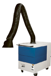
2 Dispositif d'aspiration mobile avec élément de captage