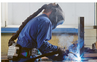
1 Casque de soudeur avec système filtrant à ventilation assistée