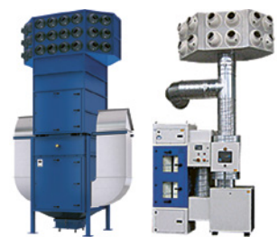
4 Systèmes de ventilation