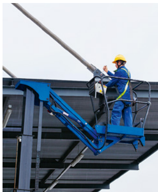
Règle 1 Prévenir les chutes