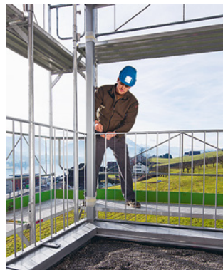
Règle 2 Contrôler chaque jour les échafaudages