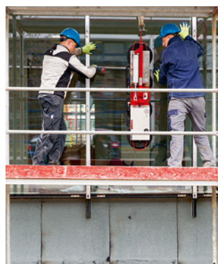
Règle 5 Déplacer les vitrages et les éléments en toute sécurité