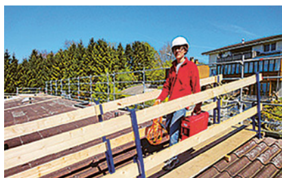
1 Toit de plaques ondulées en fibrociment.