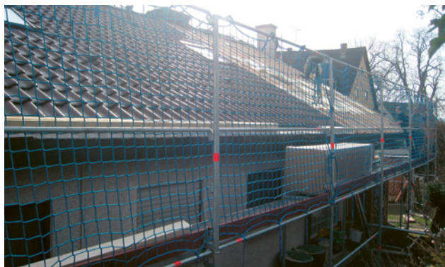
3 Korrekt erstellte Dachdeckerschutzwand mit Auffangnetz.