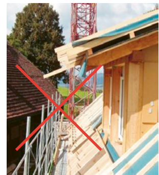
6 und 7 So nicht: unwirksame Dachdeckerschutzwände