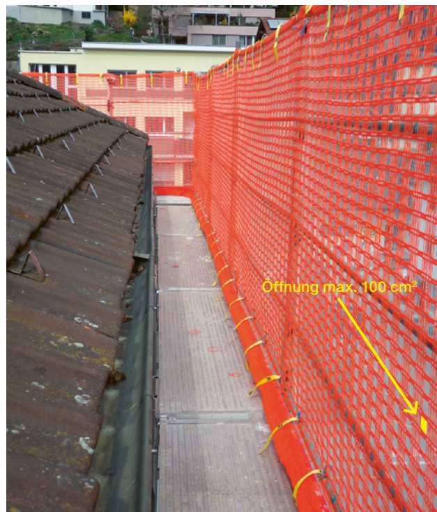
1 Korrekte und gemäss SN EN 13374 geprüfte Dachdeckerschutzwand mit Spenglerlaufnetz und Gurtbindern.