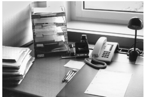
2 Une bonne organisation et de l'ordre vous épargneront, ainsi qu'à vos collaborateurs, tout stress inutile.