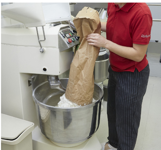
3. Vider le sac en le soulevant doucement.