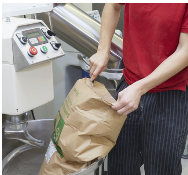
2. Couper le fond du sac.