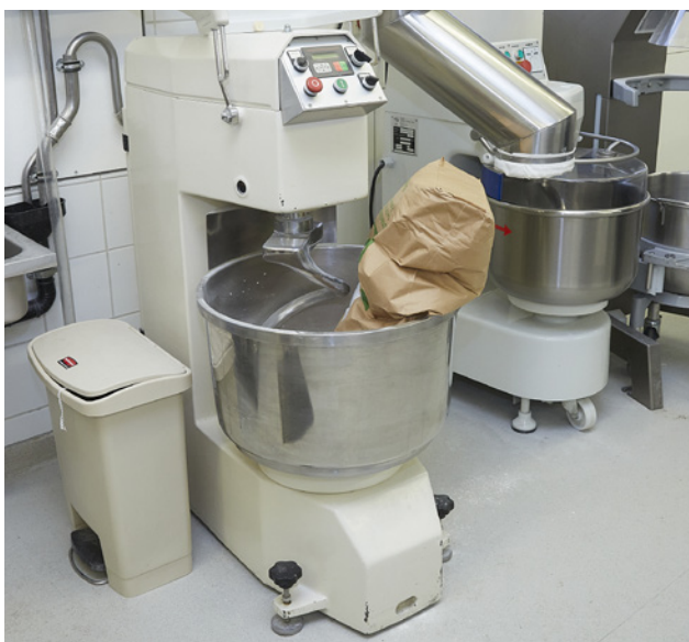
1. Placer le sac dans la cuve avec l'ouverture orientée vers le bas.