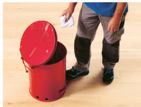
5 Éliminer correctement les chiffons imbibés d'huile de lin (respecter les consignes du fabricant)