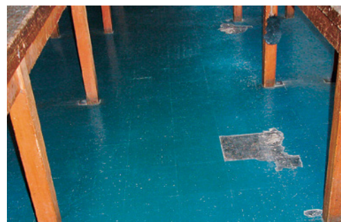
6 Identifier, évaluer et manipuler correctement les produits amiantés