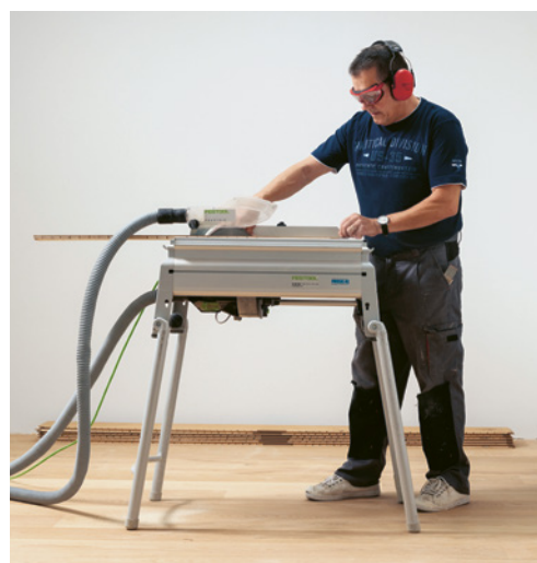
3 Scie circulaire à table équipée d'une cape de protection reliée à un système d'aspiration pour travailler en toute sécurité