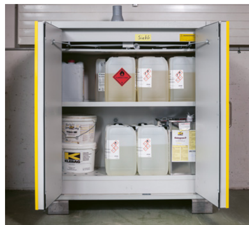
4 Entreposer correctement les produits contenant des solvants organiques; contrôler régulièrement les possibilités d'utiliser des produits sans solvants