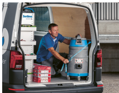
2 Sécuriser correctement le matériel transporté