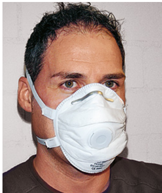
Demi-masque FFP3 à usage unique

Les masques de protection doivent être sélectionnés en fonction du danger.