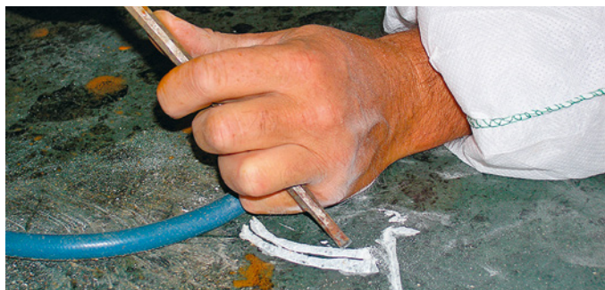
Travaux de gravure sur serpentinites