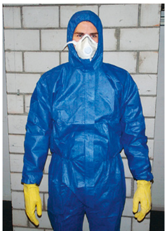
Combinaison à capuche à usage unique de catégorie III (type 5/6)

Il faut empêcher la dissémination des fibres d'amiante: ne pas emporter chez soi des vêtements contaminés par de l'amiante et utiliser les possibilités de douche et de lavage à disposition!