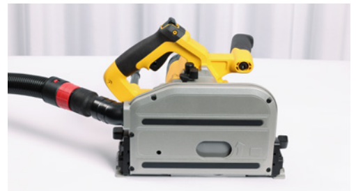
4 Handkreissäge, an den Staubsauger angeschlossen