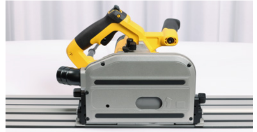
5 Beim Arbeiten mit der Führungsschiene die Maschine mit beiden Händen führen.