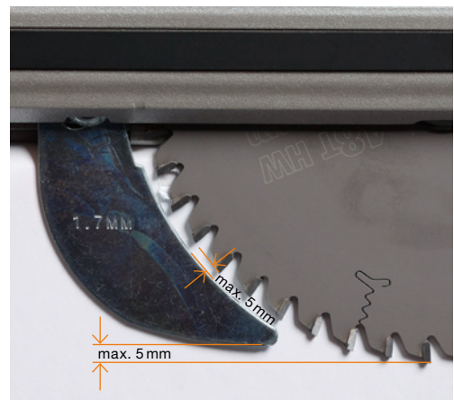
2 Handkreissäge mit korrekt eingestelltem Spaltkeil