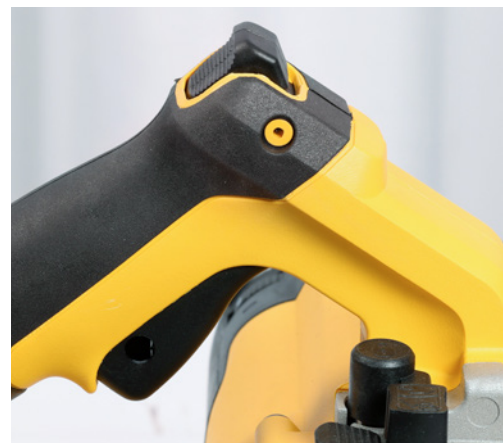
3 Dieser Schalter ist so ausgebildet, dass ein unbeabsichtigtes Einschalten verhindert wird.