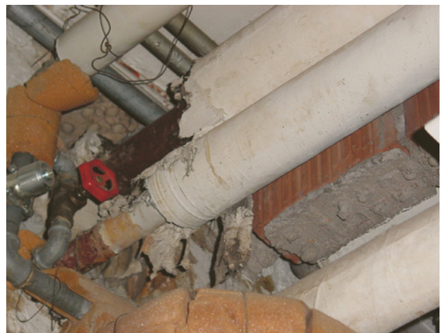
1 Malta isolante contenente amianto

Se c'è il sospetto che ci possa essere un rilascio di fibre di amianto, prima di iniziare i lavori è necessario accertare esattamente i pericoli.