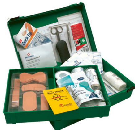
2 Anche nelle zone di lavoro mobili la mini-farmacia deve essere a portata di mano.