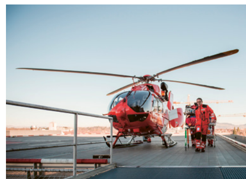
4 In caso di soccorso aereo è necessario definire le coordinate.

È possibile che sul vostro posto di lavoro sia necessario adottare ulteriori misure per quanto concerne il piano di emergenza. In caso di dubbio rivolgetevi a uno specialista.