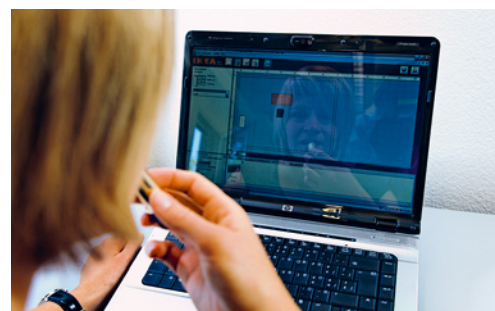
7 Bildschirme mit spiegelnder Oberfläche sind aufgrund störender Reflexionen nicht geeignet für die Bildschirmarbeit.

Ab 1 Stunde Arbeit pro Tag sind Tastatur und Maus notwendig, ab 2 Stunden wird ein zusätzlicher Bildschirm empfohlen.