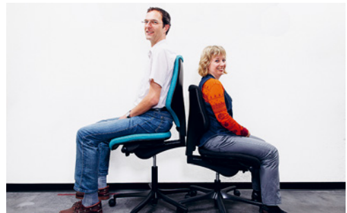
3 Für grosse Personen sind Standardstühle meistens ungeeignet. Viele Hersteller bieten ihre Stühle auch in einer Grossvariante an.