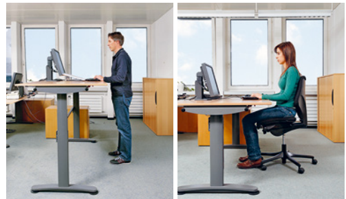
2 Ein Verstellbereich von 65 bis 125 cm gewährleistet, dass am Tisch sowohl kleine Personen sitzend als auch grosse Personen stehend arbeiten können.