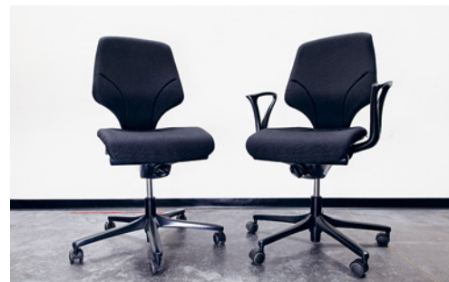
5 Armlehnen erleichtern Mitarbeitenden mit grossem Körpergewicht oder Knieproblemen das Aufstehen. Aus ergonomischer Sicht sind sie nicht notwendig.

Sind Armlehnen vorhanden, sollten sie höhenverstellbar und kurz oder in der Tiefe verstellbar sein.