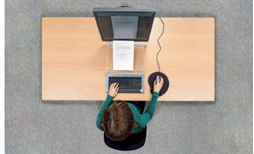
1 Der Bildschirmarbeitsplatz muss eine genügende Tiefe aufweisen, damit Tastatur, Bildschirm und Dokumente hintereinander Platz finden.