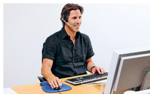
8 Wenn am Bildschirmarbeitsplatz häufig telefoniert werden muss, ist ein Headset unabdingbar.

Die Dokumentenauflage muss zum Anwender hin geneigt sein. Damit sie den unteren Bildschirmrand nicht abdeckt, darf ihre Höhe jedoch nicht mehr als 8 cm erreichen.