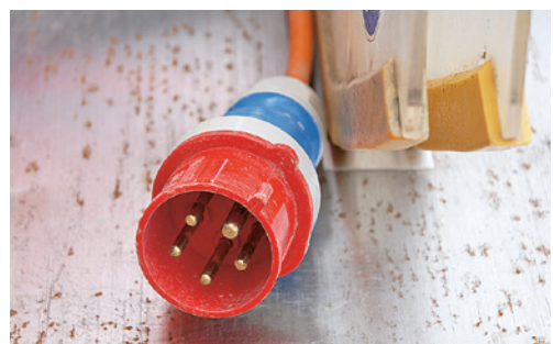
2 Les prises de courant alternatif (CEE) à cinq pôles sont rouges et rondes.