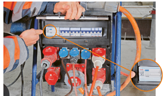
6 Tableau de chantier avec dispositif différentiel à courant résiduel (DDR). Contrôler les fonctionnalités de l'interrupteur différentiel DDR (avant le début du travail et selon les indications du fabricant).