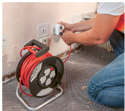
4 Utiliser l'enrouleur électrique avec un dispositif différentiel à courant résiduel mobile (DDR).