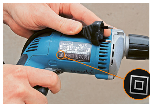
1 Perceuse de classe de protection II avec marquage correspondant