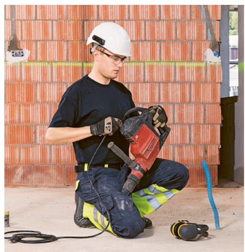
3 Perceuse à main propre et entretenue en parfait état