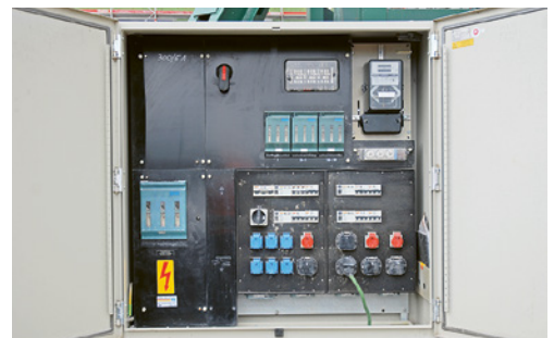
5 Le raccordement des distributeurs de chantier doit être confié à des installateurs agréés.