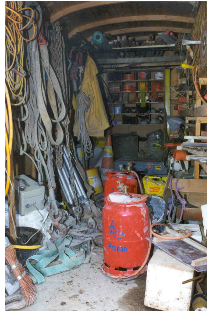
Bild 2: In einem solchen Durcheinander lässt sich die Sicherheit nicht gewährleisten.