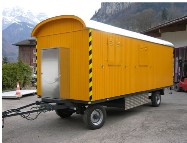
Fig.1: roulotte de chantier conforme aux prescriptions de sécurité.