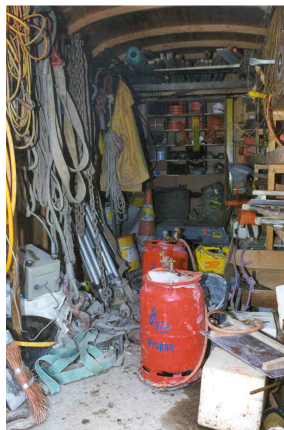
Fig. 2: dans un tel désordre, il est impossible de satisfaire aux prescriptions de sécurité.