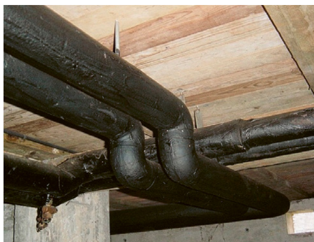
2 Isolation de tuyau avec revêtement bitumeux amianté.