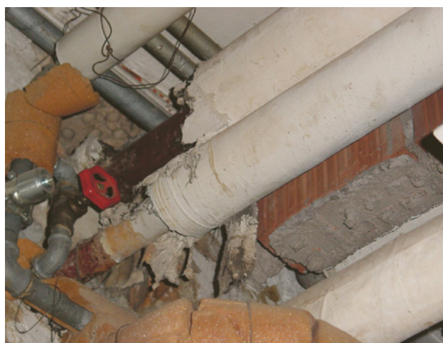
1 Isolation de tuyau avec mortier amianté.

En présence d'isolations de tuyaux susceptibles de contenir de l'amiante, le risque de libération de fibres d'amiante doit être évalué de manière approfondie avant le début des travaux.