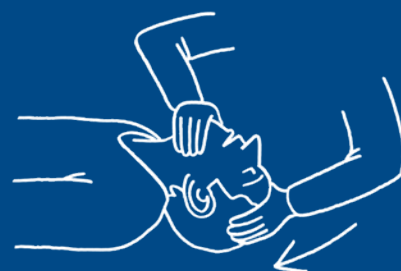
Libérer les voies respiratoires