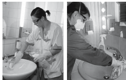
Figure 6, 7: proteggersi quando si usano decalcificanti acidi. Se l'aerazione è insufficiente, usare la mascherina.