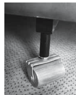
Fig. 2: applicare rotelle al letto permette di rifare il letto senza danneggiare la schiena.