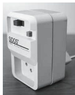
Fig. 1: le prese salvavita (interruttori FI) si trovano nei negozi specializzati.

Nota: i pavimenti in ceramica o pietra si possono rendere antiscivolo anche in un secondo tempo.