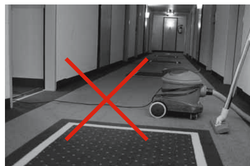
Fig. 8: i cavi a terra nei corridoi possono far inciampare.