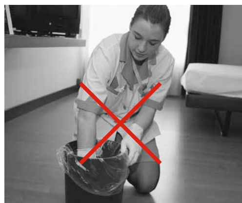
Figure 3 e 4: per evitare di ferirsi con siringhe o tagliarsi con vetri chiudere e trasportare i sacchi della spazzatura senza schiacciarli.