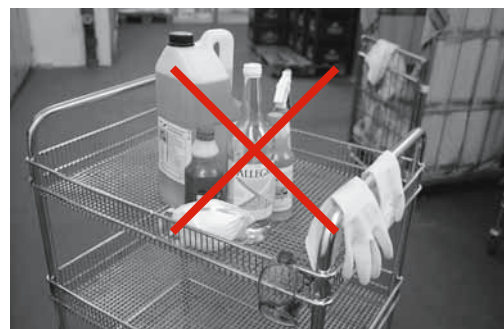
Fig. 5: per evitare intossicazioni conservare i detergenti nei contenitori originali.