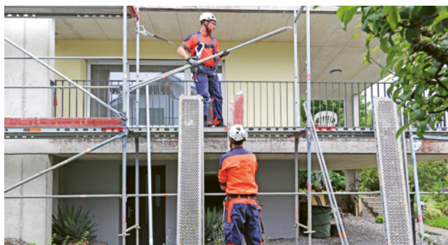
4 Montage avec des EPI antichute