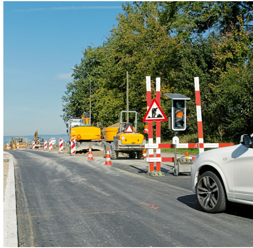
Regel 2: Wir sichern uns vor den Gefahren des Verkehrs.