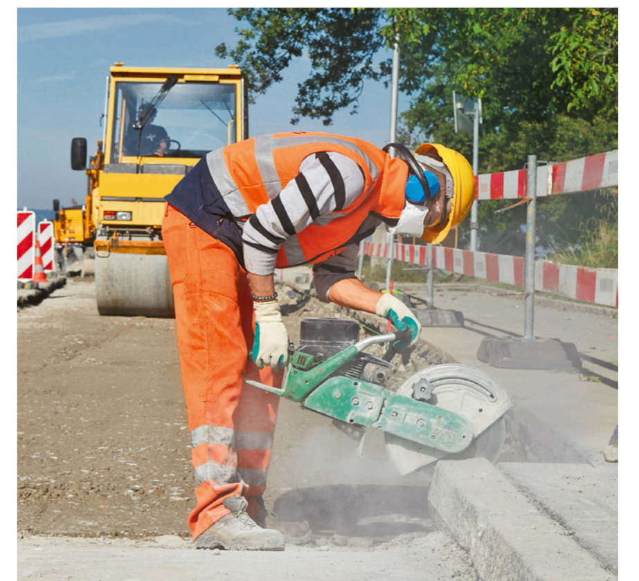
Regel 9: Wir tragen die persönliche Schutzausrüstung.