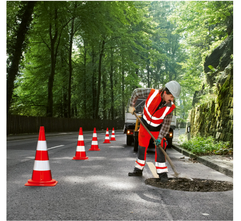
Regel 3: Sehen und gesehen werden.