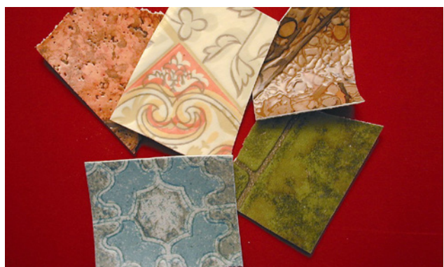
2 Les revêtements de sols multicouches (cushion vinyl) sont généralement composés de PVC et d'une sous-couche d'amiante faiblement aggloméré.