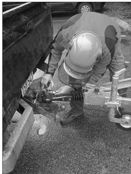
Fig. 6: controllare se il rimorchio è correttamente agganciato al veicolo trainante.