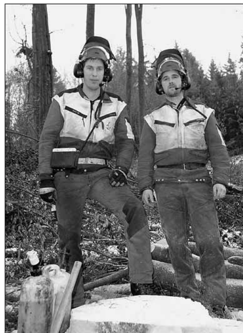
Fig. 2: gli addetti ai lavori comunicano tramite ricetrasmittente.