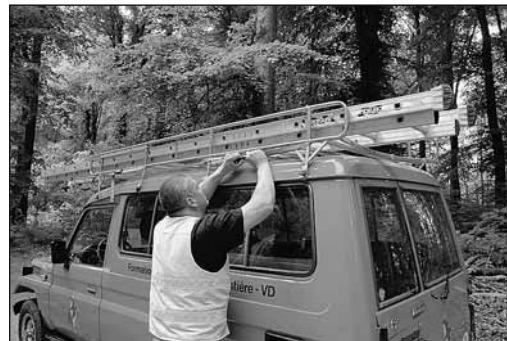
Fig. 5: fissaggio del carico sul veicolo.