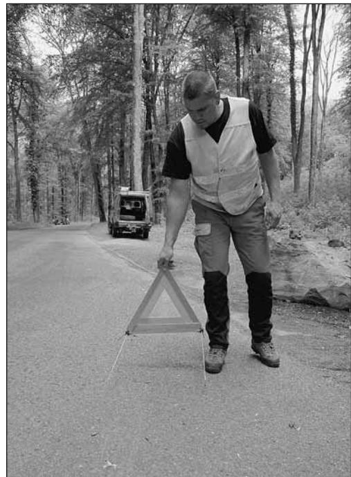
Fig. 4: in caso di panne è indispensabile avere con sé gli ausili necessari.