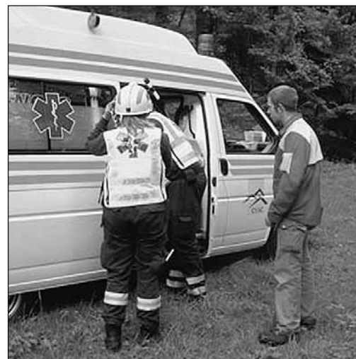
Fig. 7: punto di ritrovo per i soccorritori.

Suggerimento relativo alla domanda n. 30