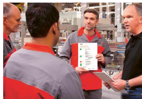
5 La marche à suivre en cas d'urgence doit être instruite et exercée régulièrement.