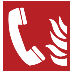
2 Pictogrammes «matériel anti-incendie» et «voie d'évacuation»