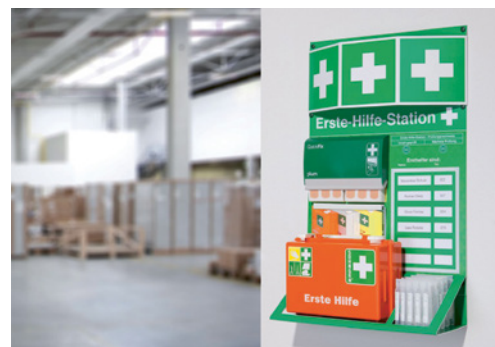
4 Poste de premiers secours