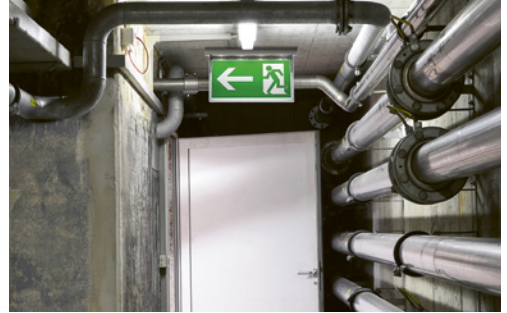
1 Signal indiquant une voie d'évacuation ou une issue de secours