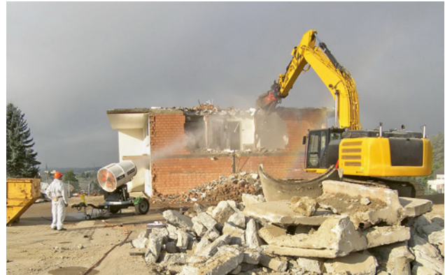
Rückbau mit einem Hydraulikbagger

Bei Rückbauarbeiten nach einer besonderen Arbeitsmethode sind in jedem Fall die Massnahmen gemäss EKAS-Richtlinie 6503 «Asbest» einzuhalten. Dazu gehören insbesondere die Gefährdungsermittlung, die Instruktion der Mitarbeitenden (Tragen von PSA usw.), das Einhalten der sachgerechten technischen Massnahmen, Zutrittsregelung für Dritte, Reinigung des Arbeitsbereichs nach Abschluss der Arbeiten.