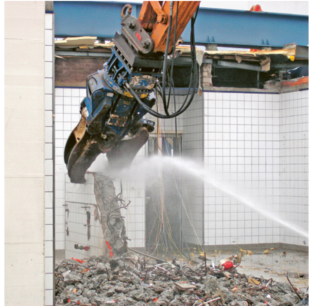
Keramikplatten mit asbesthaltigem Plattenkleber

Bei Rückbauarbeiten nach einer besonderen Arbeitsmethode sind in jedem Fall die Massnahmen gemäss EKAS-Richtlinie 6503 «Asbest» einzuhalten. Dazu gehören insbesondere die Gefährdungsermittlung, die Instruktion der Mitarbeitenden (Tragen von PSA usw.), das Einhalten der sachgerechten technischen Massnahmen, Zutrittsregelung für Dritte, Reinigung des Arbeitsbereichs nach Abschluss der Arbeiten.