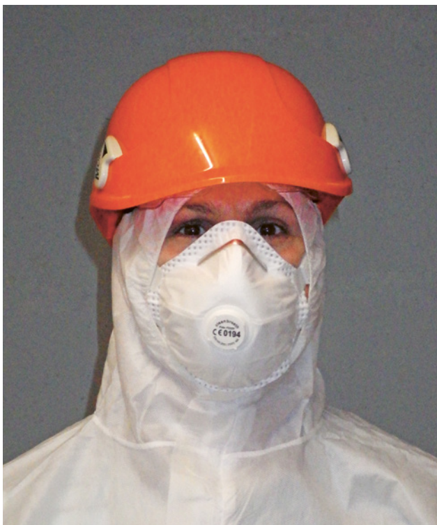
Atemschutzmaske vom Typ FFP3 und Einweg-Overall

In Zusammenarbeit mit verschiedenen Branchenverbänden hat die Suva zudem praxisbezogene Leitfäden erarbeitet, die in der Reihe «Asbest erkennen, beurteilen