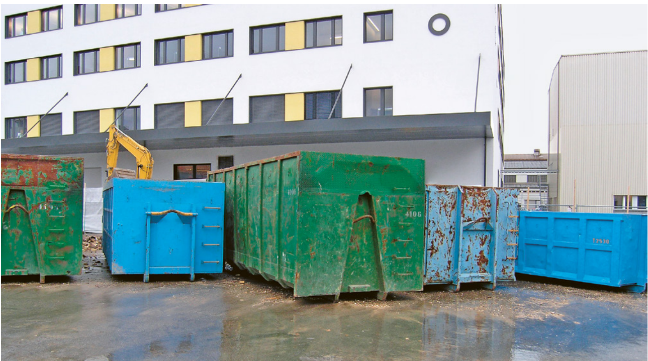
Abfallmulden für Asbest

Bestehen seitens der kantonalen Umweltbehörden weitergehende Auflagen, sind diese zu berücksichtigen.