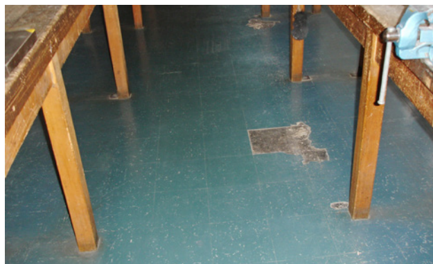
1 Rivestimenti monostrato floorflex. In questo caso l'amianto è inglobato in una matrice compatta.

Se si sospetta che la rimozione dei rivestimenti sintetici possa causare un elevato rilascio di fibre nell'aria, i rischi devono essere accertati prima di iniziare i lavori.