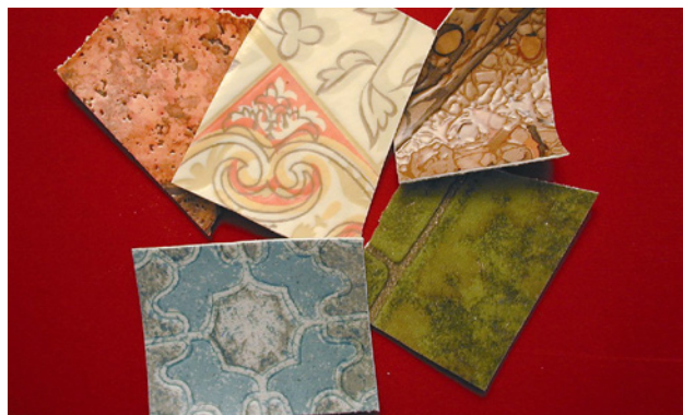
2 I rivestimenti multistrato per pavimenti (cushion vinyl) presentano solitamente uno strato portante in PVC contenente amianto in matrice friabile.