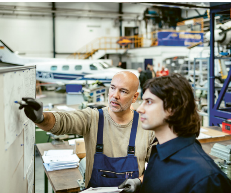
1 L'AdSic deve avere capacità di immedesimazione, forza di persuasione e conoscenze tecniche.

Per svolgere il suo lavoro, l'addetto alla sicurezza deve disporre di precise conoscenze e capacità. L'addetto alla sicurezza deve essere scelto scrupolosamente e formato in modo mirato. Se all'interno di una piccola azienda è il dirigente stesso ad assumere questa funzione, è importante che egli disponga delle conoscenze necessarie.