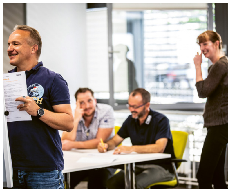
5 La sicurezza sul lavoro e la tutela della salute devono essere all'ordine del giorno durante le riunioni interne.

Integrate regolarmente i diversi aspetti della sicurezza sul lavoro nelle istruzioni di lavoro per i vostri collaboratori.