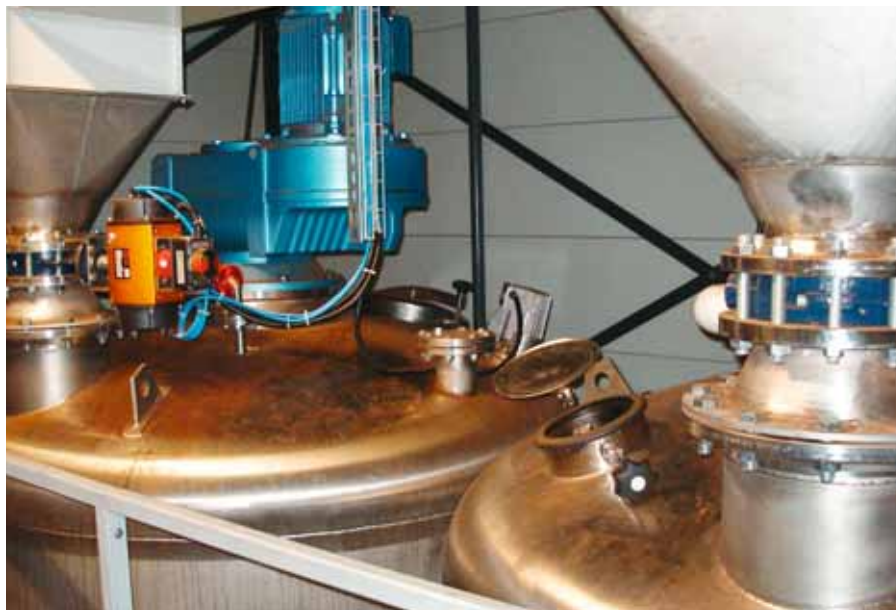
01 // Der Mitarbeiter stieg in den linken Behälter, um einen hineingefallenen Schaber herauszuholen.

Ein Mitarbeiter eines Lebensmittel verarbeitenden Betriebs liess ein Werkzeug in einen Behälter einer Produktionsanlage fallen. Als er es herausholen wollte, atmete er Lösemitteldämpfe ein und starb an einer akuten Vergiftung.