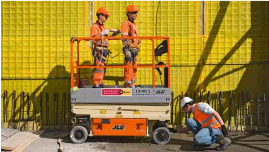
01 // 5@11: Eine erfolgreiche Massnahme der Firma Losinger-Marazzi.