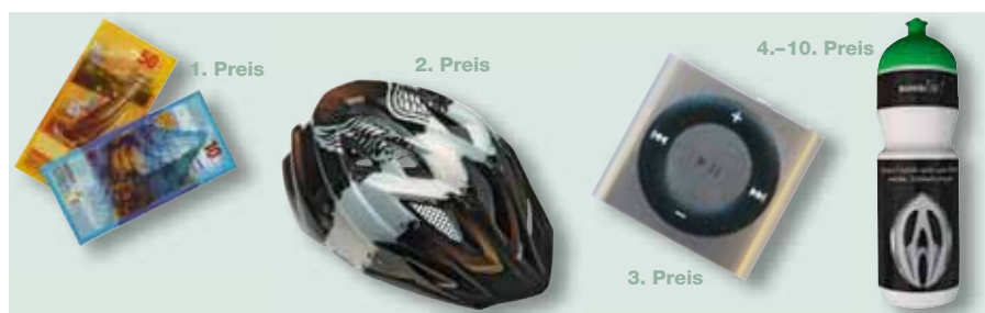
Preise // 1. Preis: Reka Checks im Wert von 200 Franken // 2. Preis: Ein Velohelm Ihrer Wahl // 3. Preis: Ein iPod-Shuffle // 4.-10. Preis: Eine Suva-Trinkflasche

Für viele sind iPod und MP3-Player nicht mehr aus dem Alltag wegzudenken. Egal ob beim Spazieren, im Bus, beim Einkaufen: Die Kopfhörer sind aufgesetzt und Musik begleitet durch den Tag. Untersuchungen haben ergeben, dass jeder fünfte Jugendliche mit Kopfhörer oder Ohrstöpseln Musik hört, wenn er zu Fuss oder auf dem Fahrrad unterwegs ist. Doch wenn im Strassenverkehr die Umgebungsgerausche von der Musik in den Ohrhörern übertönt werden, ist das eine tödliche Gefahr.