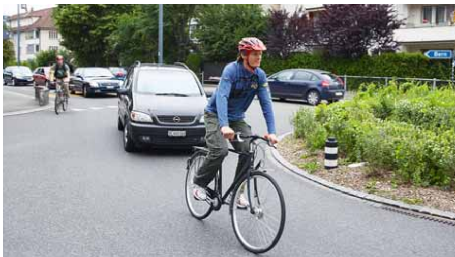
01 // Einen Kreisel zu befahren ist ein anspruchsvolles Manöver und nur die junge Generation hat bei der Auto- oder Veloprüfung genau gelernt wo die Gefahren liegen. // Bild: bfu

Am häufigsten kommt es zu Kollisionen, weil Velofahrende oder Fahrzeuglenker den Vortritt missachten. Weiter sind Unaufmerksamkeit und falsches Manövrieren häufige Unfallursachen. Die Suva fokussiert deshalb nun auf das optimale