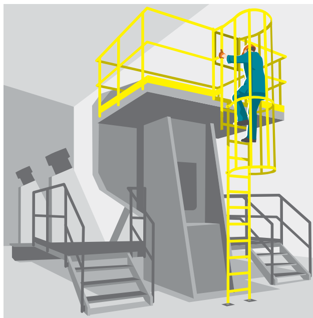
1 Accès à une plateforme de travail sur une machine.

Désormais, les échelles fixes sur machines doivent remplir les exigences de la norme ISO 14122-4.